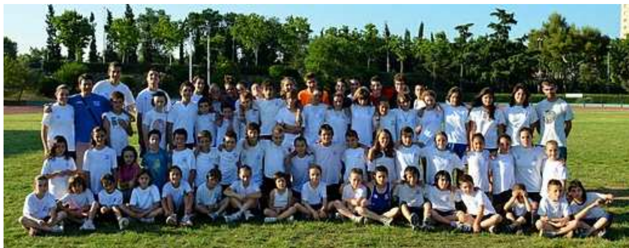
Escola d'Atletisme del Club Atlètic Granollers - Promoció 2010-2011